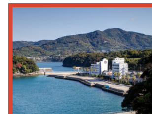
【湯の児温泉 海と夕やけ泊】